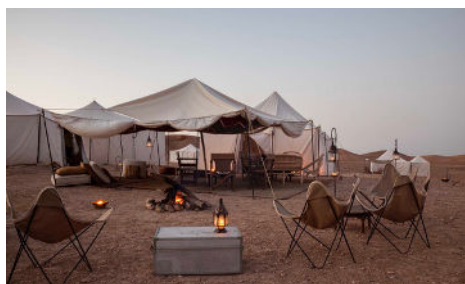
Campament al desert d'Agafay