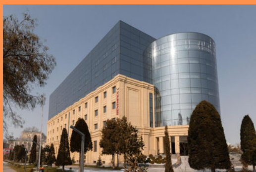
Mövenpick Hotel Samarkand 5*