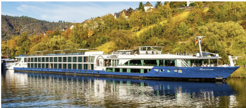
Vaixell MS Leonora 4*